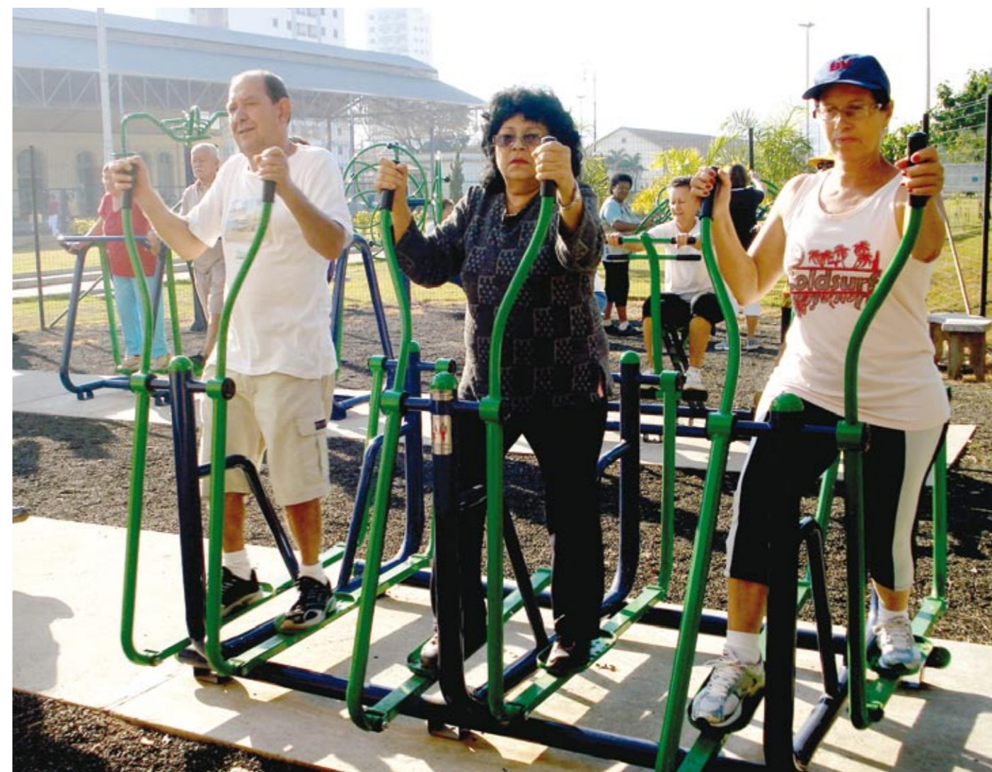
Academia da Terceira Idade. em Piracicaba - atendimento especial a idosos

A especialista ainda comenta que os adultos estão cada vez mais atentos a esta orientação. “Trabalhando a prevenção ainda na fase adulta, a chance de sofrer menos na velhice é quase total. Logo, o binômio alimentação mais a prática de exercícios físicos nunca foi tão defendido por aqueles que almejam a longevidade com qualidade de vida”, conclui.