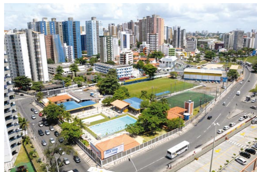
ASBAC Salvador, local onde se reúnem os integrantes do Skindô

De acordo com o aposentado, o grupo surgiu devido ao apego entre companheiros de