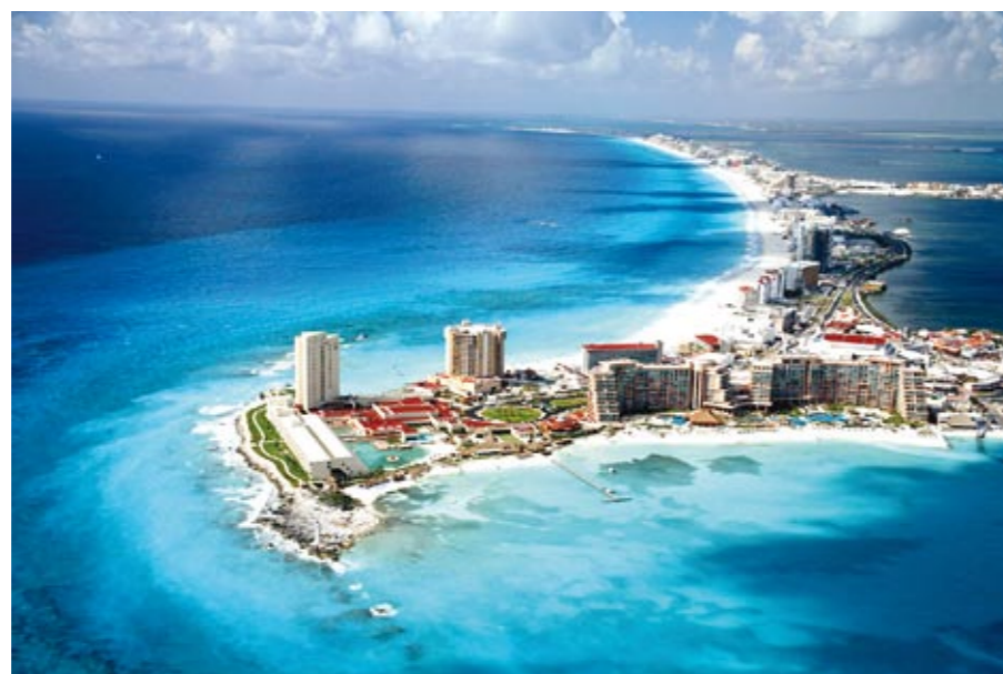
Cancun, no México: Um dos destinos preferidos pelos idosos

Enquanto o pessoal de Salvador se diverte com o Skindô, aposentados do país inteiro procuram diversão viajando em grupos ou até mesmo sozinhos. O que vale é a diversão.